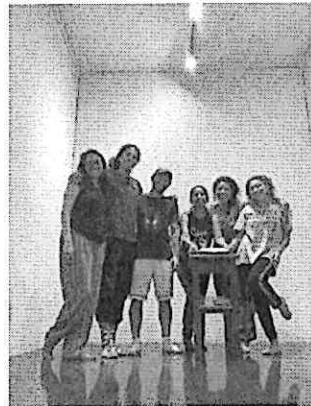
Ensayos en salón de espejos