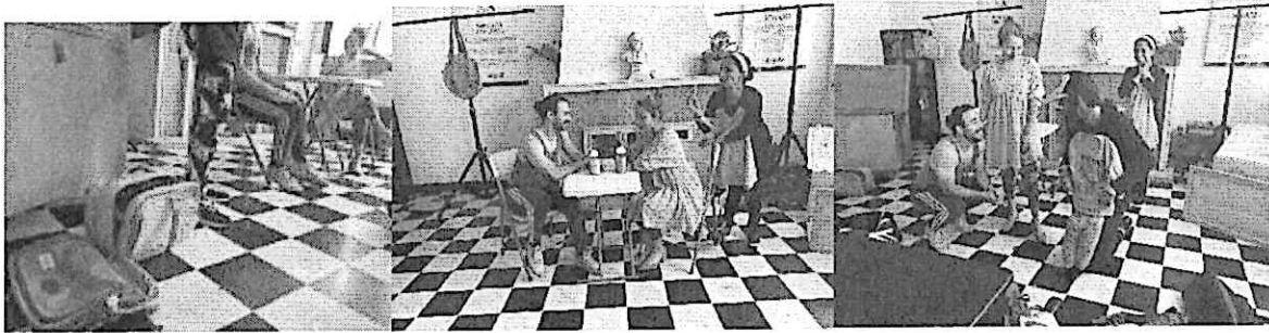
Ensayo general 1