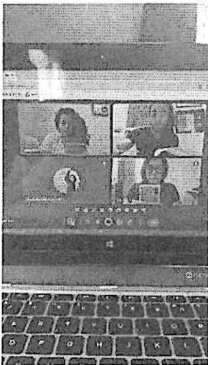
Trabajo de mesa: Análisis de texto