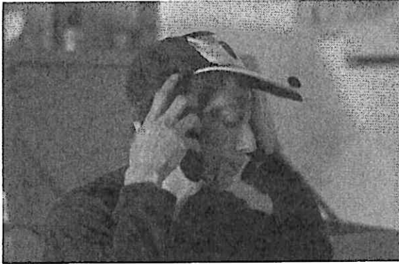
Transformación en escena de El otro a Bengi