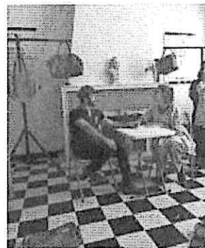
Primeros ensayos en Nueva acrópolis