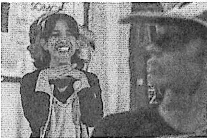
La otra, ilusionada con el Bengi