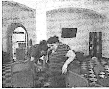
Prueba de Escenografía y luces