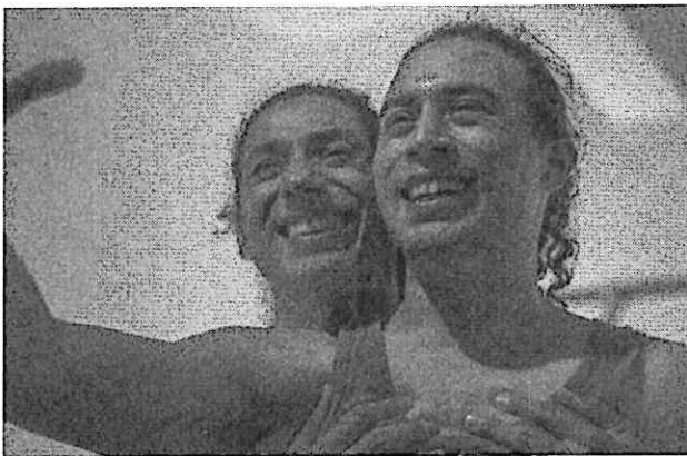
Preparandose para la cita