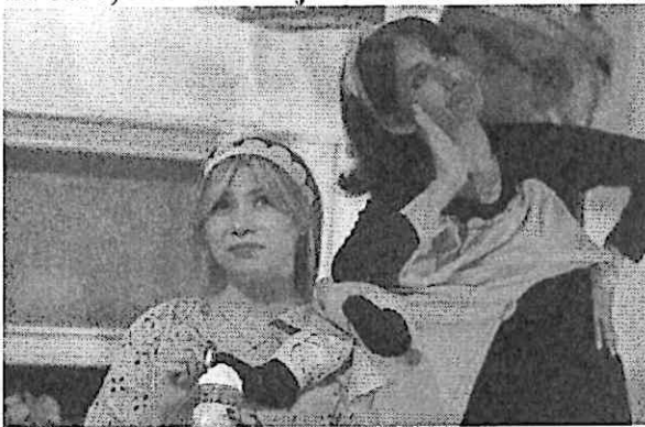
Ella y La otra