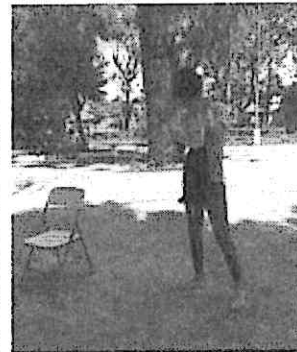
Ensayos en parque Jocotenango