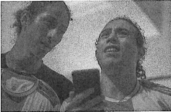
El otro, mal aconsejando a Él