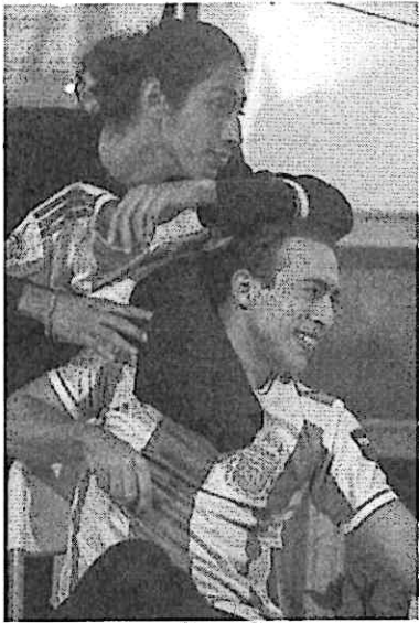
Personajes Èl y Èl otro