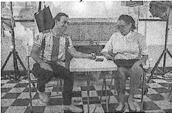
El y la mesera en el chisme final.