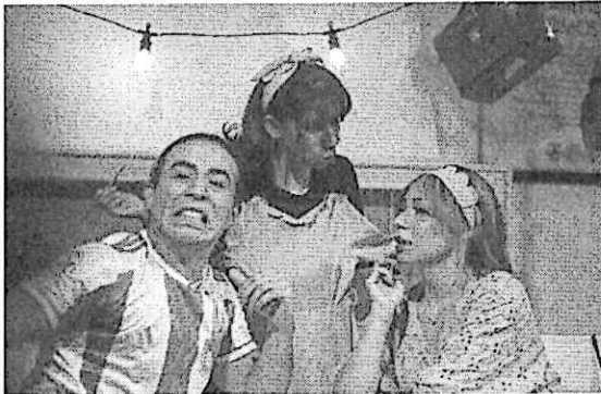
Èl dándose cuenta que metió la pata